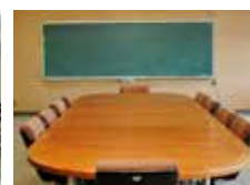
会議室兼視聴覚室