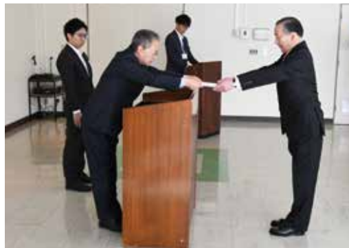
市村配分金交付式 令和6年10月31日